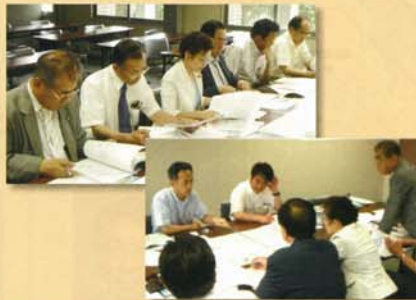
六月二十二日 市議員六名と今後の展望について確認した。